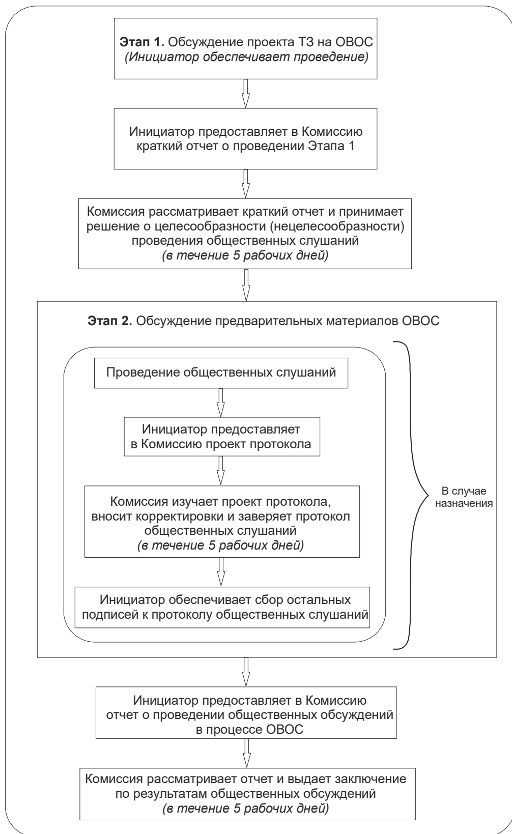
Рисунок 2. Общественные обсуждения в процессе ОВОС намечаемой деятельности