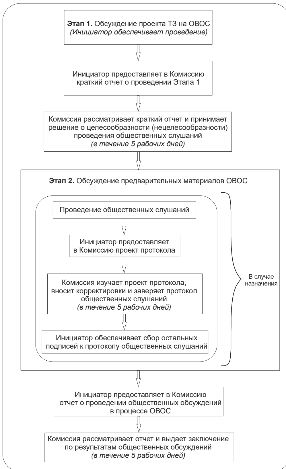
Рисунок 2. Общественные обсуждения в процессе ОВОС намечаемой деятельности